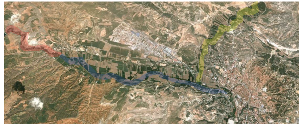
Imágenes satélite y mapa de ubicación de la propuesta NaturarTeruel